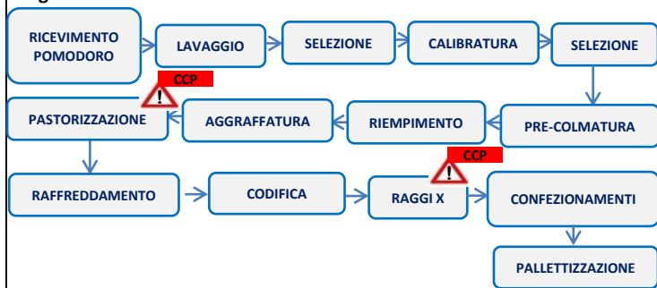
Diagramma di flusso

Les valeurs nutritionnelles sont calculées sur la base des données analytiques et des tables de composition des aliments